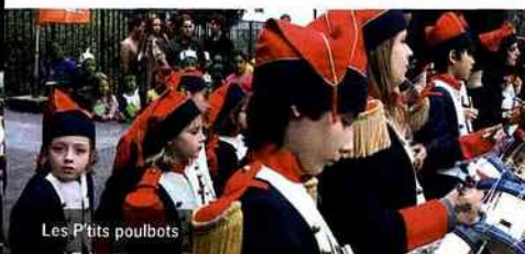
Les P'tits poulbots