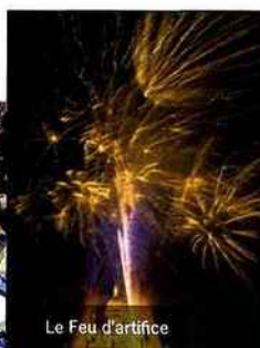
Le Feu d'artifice